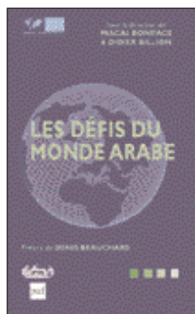
Editions PUF/IRIS 300 pages - 16 €

Autant de questions et de sujets autour desquels la Sonacotra a convié les décideurs politiques, économiques et financiers, les universitaires et les acteurs de terrain les plus qualifiés, afin d'élaborer une vision d'ensemble claire et précise des défis de l'intégration en Europe.