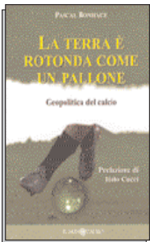
Edition Il Minotauro 192 pages - 12,50 €

Pascal Boniface analyse ce mécanisme dangereux qui risque d'importer en France le conflit du Proche-Orient. Enfin, il donne des informations et des réflexions propres à rétablir une vision équilibrée sans laquelle aucune négociation de paix ne sera possible.