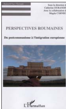
Coll. Aujourd'hui l'Europe Editions L'Harmattan 304 p. - 25,50 €