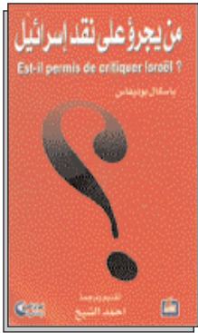
Edition Dar ElFarabi (Beyrouth) 263 pages