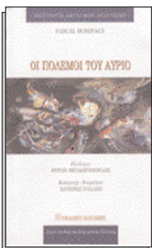
Edition Papazissis 270 pages

Pascal Boniface met en valeur, de façon aussi rigoureuse que plaisante, les multiples liens entre la conduite des affaires mondiales et le football. Il décrit ceux qui existent entre la nation et le football pour chacun des 32 pays qualifiés pour la Coupe du monde 2002.