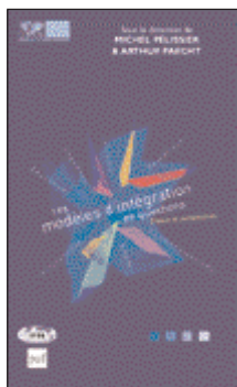
Editions PUF/IRIS 150 pages - 16 €